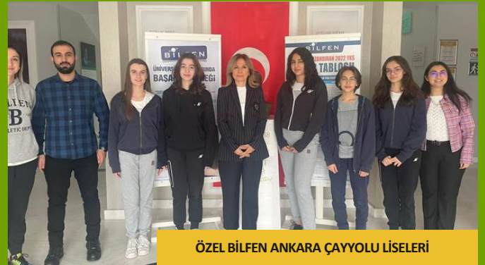
ÖZEL BİLFEN ANKARA ÇAYYOLU LİSELERİ