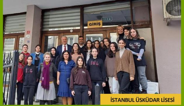
İSTANBUL ÜSKÜDAR LİSESİ