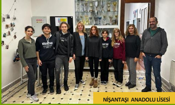
NİŞANTAŞI ANADOLU LİSESİ