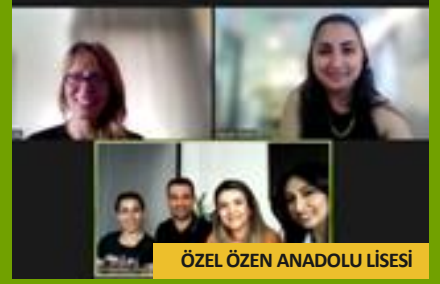
ÖZEL ÖZEN ANADOLU LİSESİ