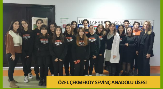
ÖZEL ÇEKMEKÖY SEVİNÇ ANADOLU LİSESİ