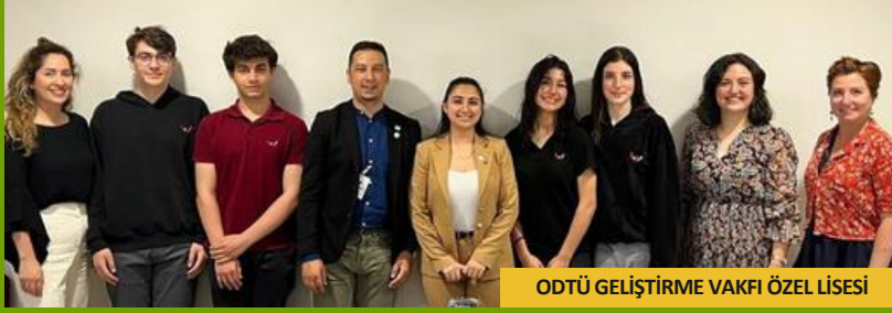
ODTÜ GELİŞTİRME VAKFI ÖZEL LİSESİ