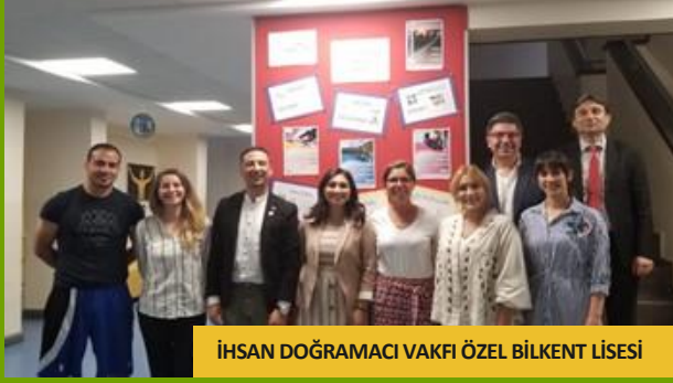
İHSAN DOĞRAMACI VAKFI ÖZEL BİLKENT LİSESİ